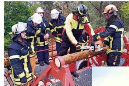
15 Feuerwehrleute waren am Wochenende an der Ausbildung teilgenommen, um einen besseren Umgang mit Motorsägen zu erlangen.

Die Ausbildung des Landesfeuerwehrverbandes, in Kooperation mit Unfallkasse des Saarlandes und in Abstimmung mit Lan-