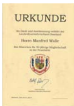
Ehrungen langjähriger Mitglieder für 40, 50, 60 und 70 Jahren in der Feuerwehr