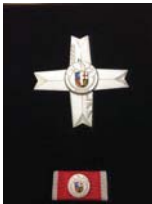
LFV Ehrenkreuz in Gold und Silber