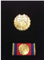
LFV Ehrenspange in Gold, Silber und Bronze